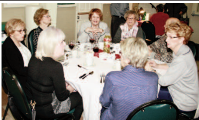
Table du souper de Noël 2017

Certains membres voudraient que l'on donne la priorité à nos membres... comme réponse, nous pouvons dire que nos membres sont les premiers avertis de tout ce qui se passe au Centre récréatif.