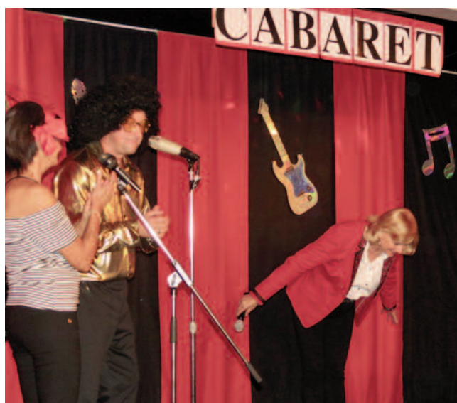
Nos membres... des vedettes!