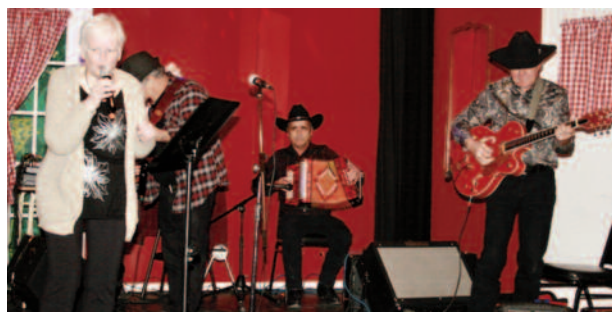
Photo du party des Rois 2018