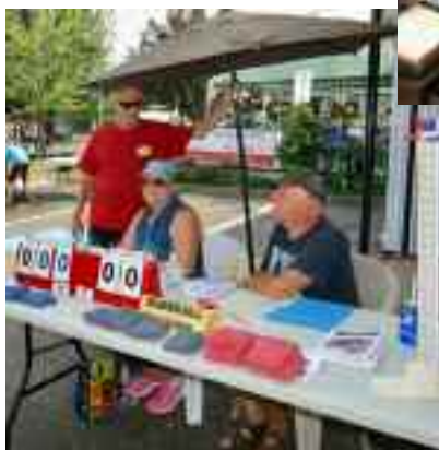
Un bon moment pour parler baseball-poches