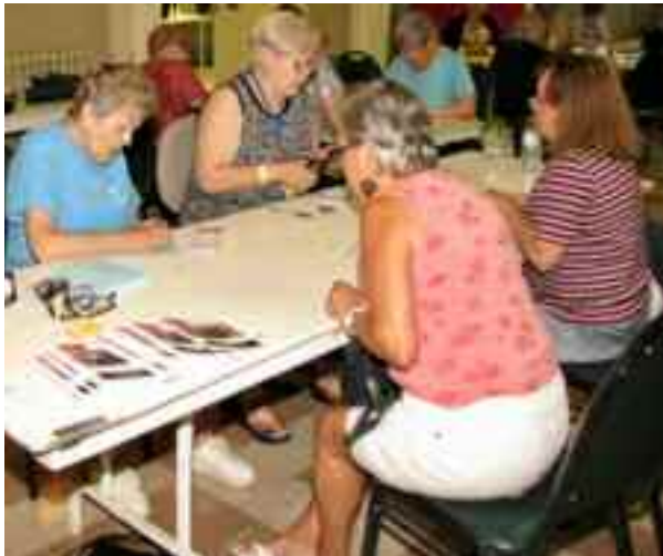
Les secrétaires à l'oeuvre!