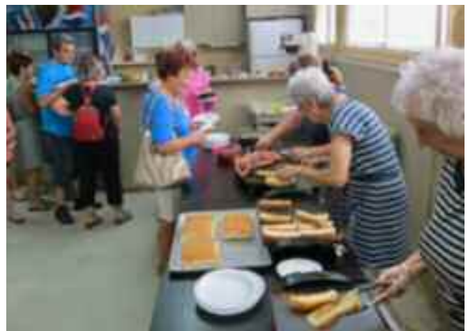
Combien de douzaines de hot dogs?