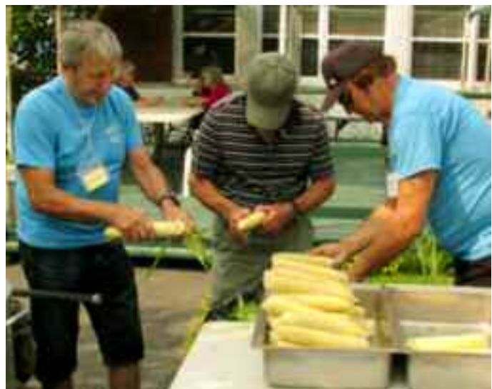
Les cinq poches de blé d'inde y ont passé!