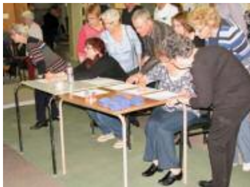
Tout le monde veut savoir!