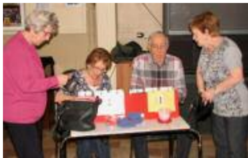
Au baseball-poches, il faut des capitaines si on veut que tout baigne dans l'huile.