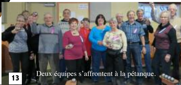
Deux équipes s'affrontent à la pétanque.

Réponse à l'énigme de la page 9: 41 carrés