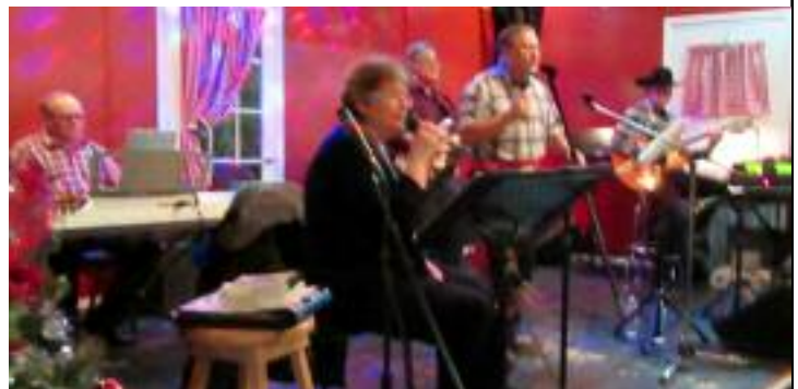
Les musiciens du vendredi soir avec deux chanteurs animaient la fête.