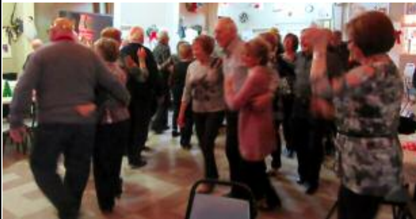
Les gens ne sont pas venus pour rester assis; ils se sont levés et ont participé activement à l'animation en remplissant la piste de danse.