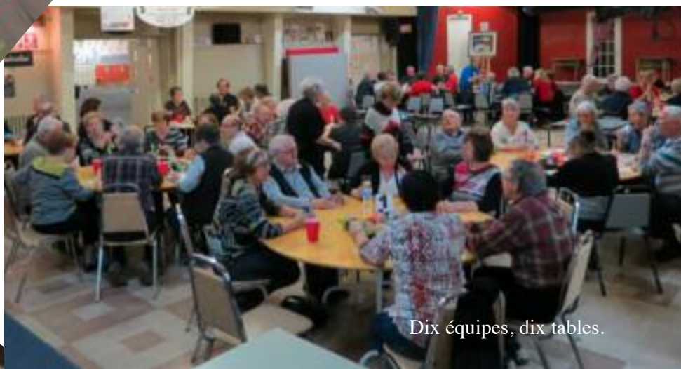
Dix équipes, dix tables.