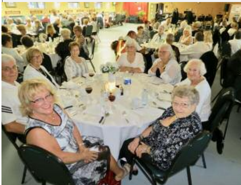
Une salle bien remplie d'âné(e)