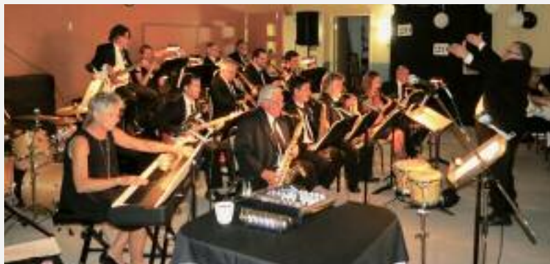
Le Band de l'Harmonie Calixa-Lavallée