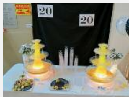
Un bon cocktail de bienvenue